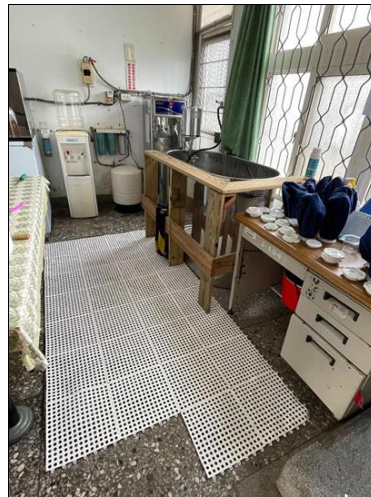
水療區(109 年建置完整)