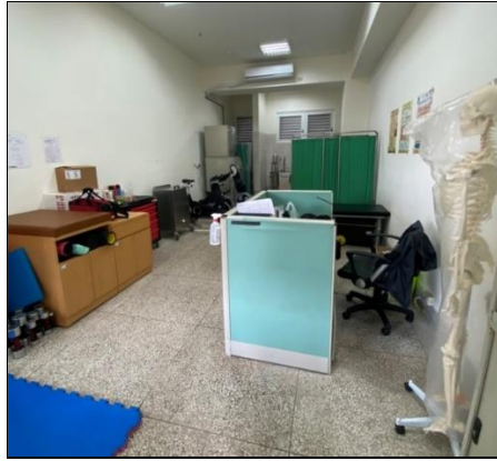
苗栗縣立 苑裡高級中學