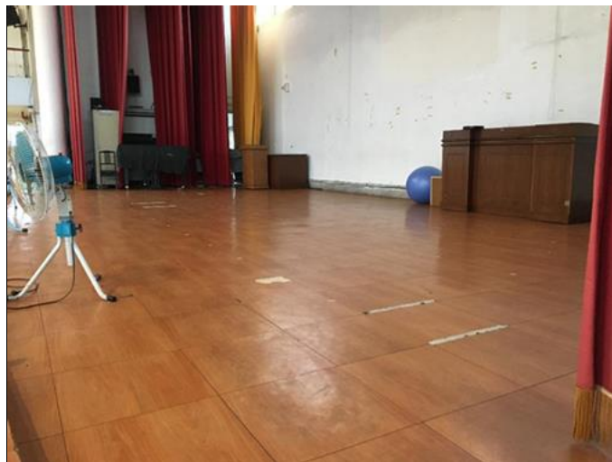
運動治療區(107 年草創期)