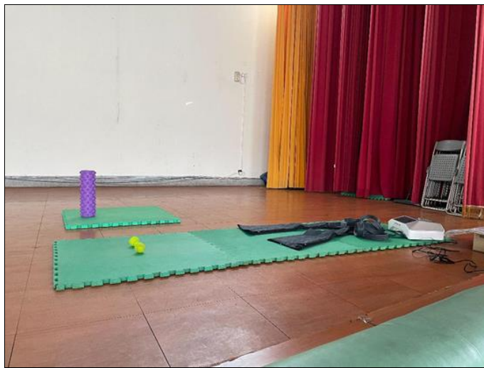
運動治療區(109年建置完整)