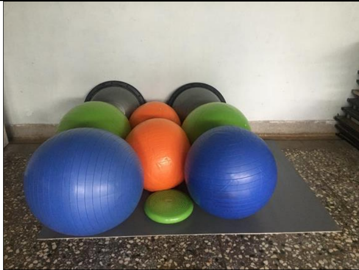
防護耗材及訓練器材存放區(107年草創期)