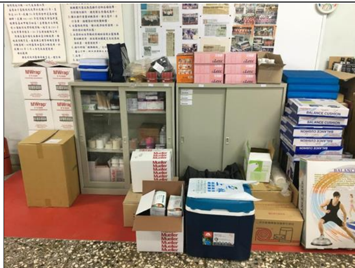
防護耗材集訓臉器材存放區(109年建置完整)