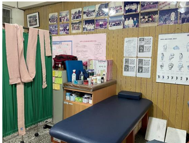
運動貼紮區(109年建置完整)