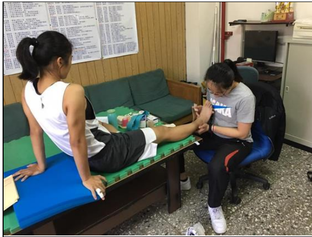
運動貼紮區(107年草創期)