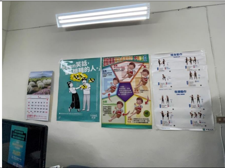
國立基隆高級中學