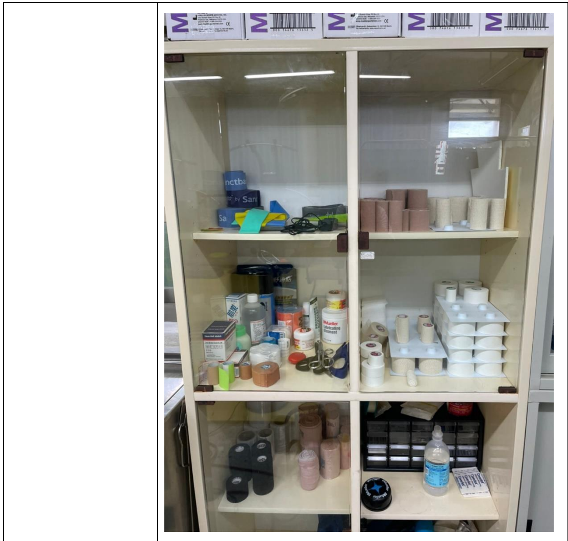
國立基隆高級商工 職業學校