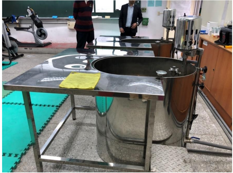
基隆市立安樂高級 中學